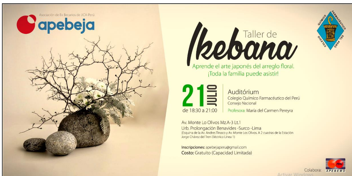
Poster del evento