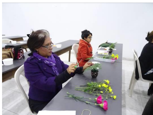
Elaborando el arreglo floral