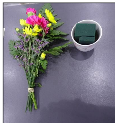
Kit con flores y hojas

Los participantes siguen las indicaciones de la profesora para aplicar la técnica de ikebana, técnica que implica expresar el YO interior a través de la estructura del arreglo floral, como producto de ese dialogo interior se obtuvieron arreglos personalizados.