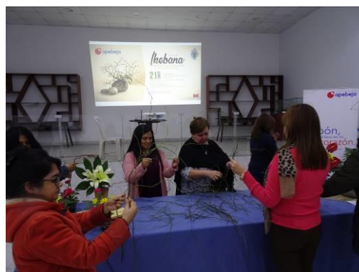
Seleccionando la rama para el arreglo floral