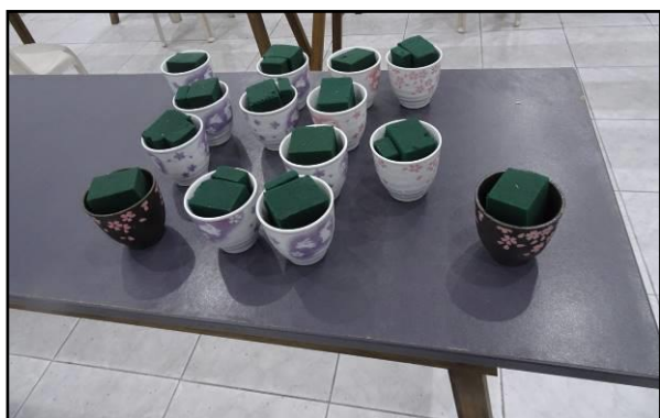
Florero en diversos modelos

Cada participante elaboró su arreglo floral utilizando como materiales un jarrón con oasis, flores, hojas, ramas, recipiente con agua y tijera.