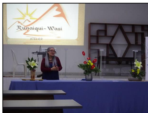
Demostración de la técnica Ikebana

Cada participante elaboró su arreglo floral utilizando como materiales un jarrón con oasis, flores, hojas, ramas, recipiente con agua y tijera.