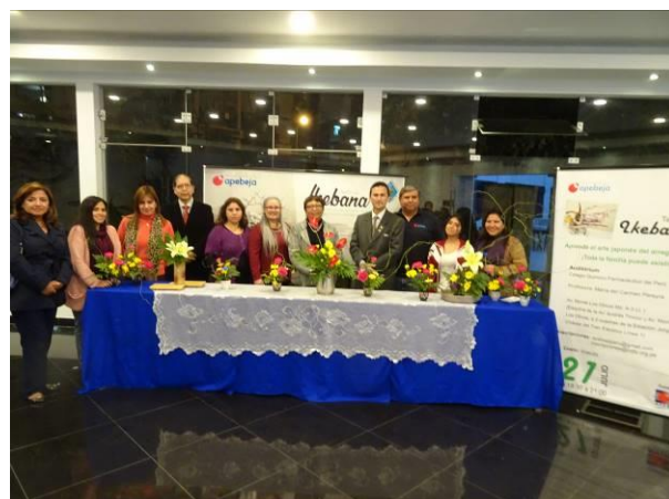
Participantes del Taller de Ikebana