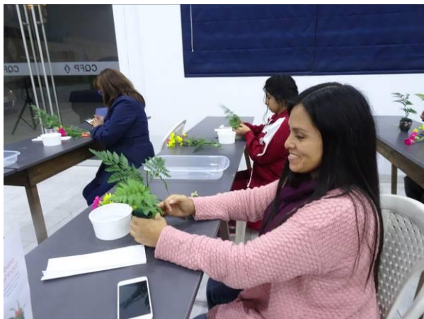
Seleccionando las hojas para el arreglo floral