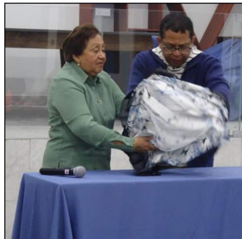
Demostración de la técnica Furoshiki

Los participantes siguen las indicaciones de los profesores para aplicar la técnica de Furoshiki para envolver sus cajas y botellas.