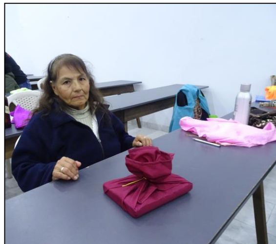
Participantes envolviendo sus cajas