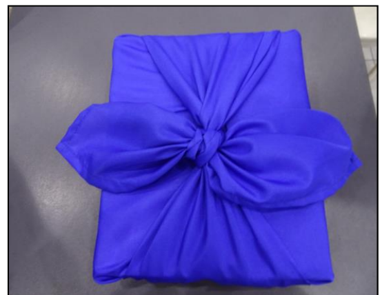
Ejemplos de envoltura realizada por los participantes