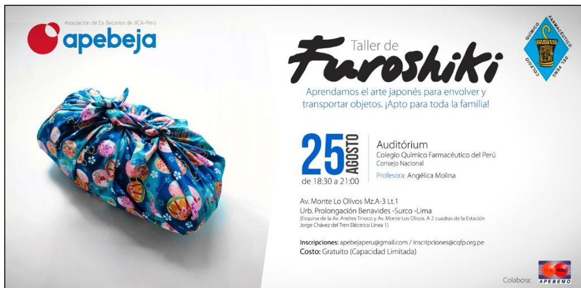
Poster del evento