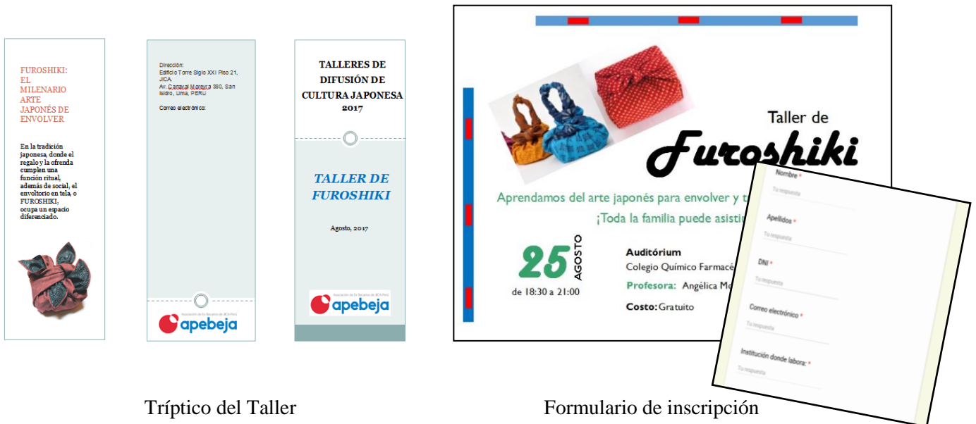
Tríptico del Taller

Previamente al taller, APEBEJA organizó su diseño y difusión: