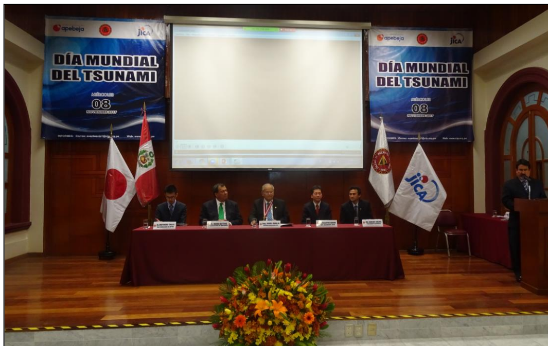
Mesa de honor del evento